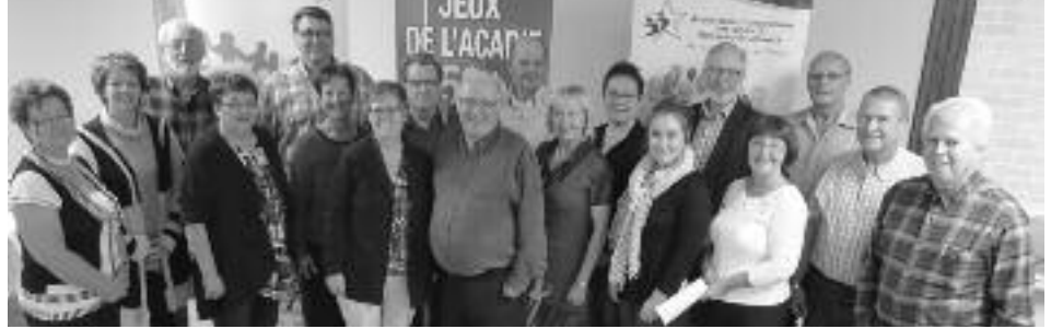
Participantes et participants à la rencontre du réseau.

C'est en marge de l'Assemblée générale annuelle du Mouvement acadien des communautés en santé du N.-B. qui se tenait le 19 octobre dernier, à Tracadie, la rencontre annuelle des représentantes et représentants des Municipalités et Communautés amies des aînés du Nouveau-Brunswick francophone.