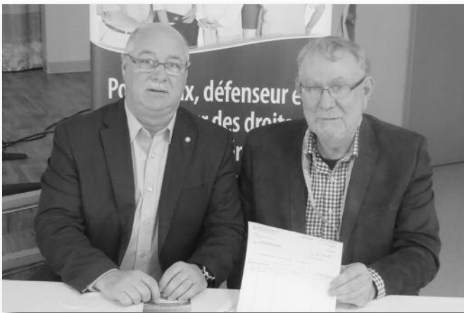
Signature de l'entente avec les Assurances générales Acadie pour une durée de trois ans.