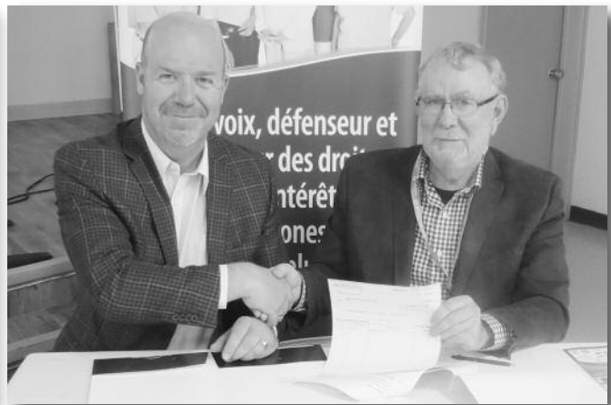
Signature de l'entente avec les Caisses populaires acadiennes pour une durée de deux ans.