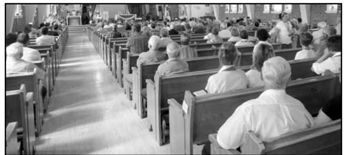
Un moment de répit et de calme après une journée remplie d'activités.