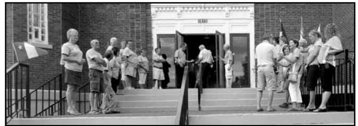
Une garde d'honneur formée de bénévoles nous accueillait à l'église pour la messe des Jeux.