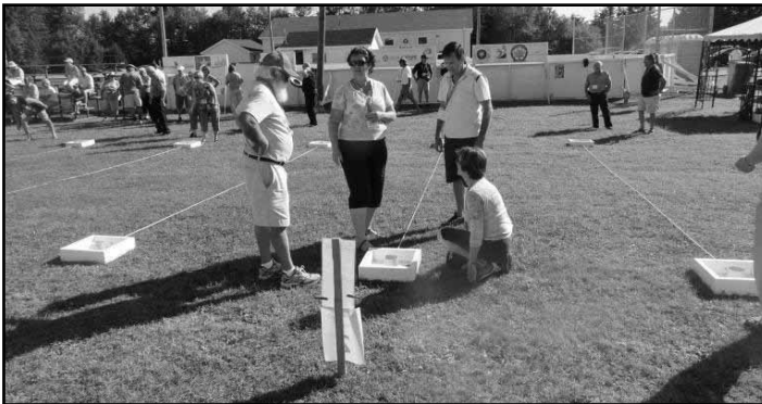
En cas de litige au Jeux de 'washers', on appelle le président du conseil d'administration des Jeux à la rescousse!