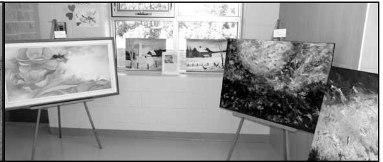
Quelques-uns des trésors présentés par nos artistes