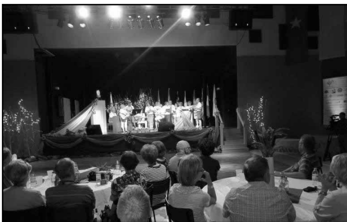
Une soirée réussie ne peut se terminer sans un peu de musique...