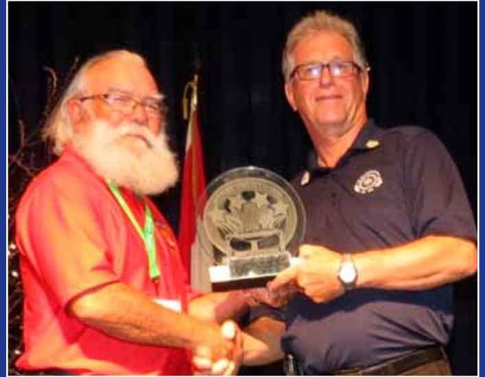
Les 3e Jeux des aînés de l'Acadie à Balmoral : sous le soleil, dans la bonne humeur et la joie de vivre!