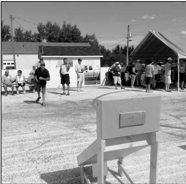
Un peu de concentration et le compas dans l'oeil, on est prêt pour le 500 au jeu de poches!