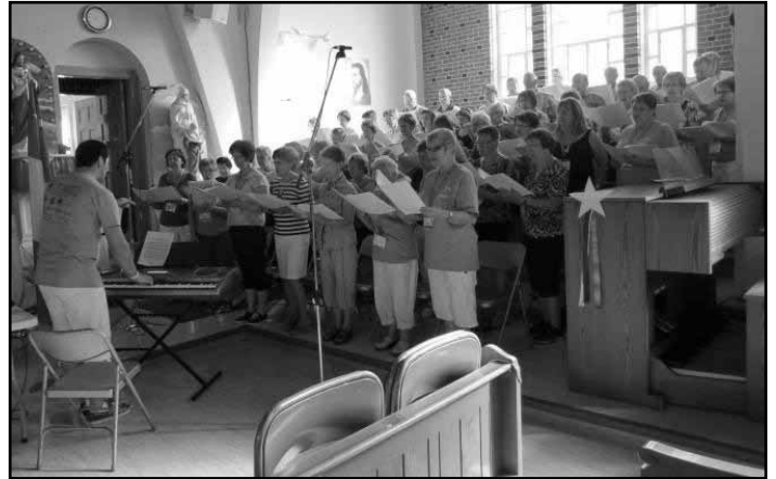
Rien de mieux que le chant choral pour élever l'âme et dégager les poumons!