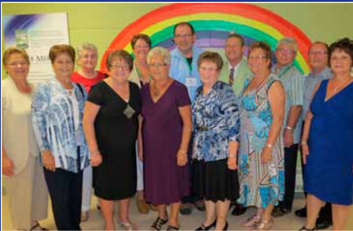
Mission accomplie pour le comité organisateur du Congrès et de l'AGA 2012!