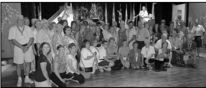
Le groupe des premiers médaillés des Jeux