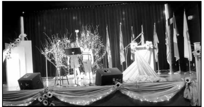
Moment solennel, l'arrivée de la flamme des Jeux.