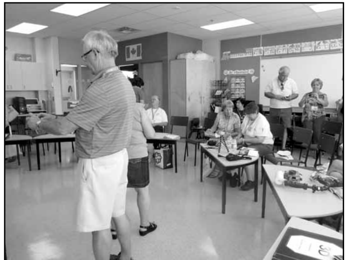
On vérifie les équipements avant le safari-photos.