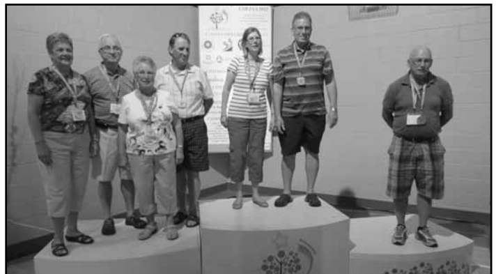
Quelques-uns de nos médaillés du jour, posant fièrement sur le podium.