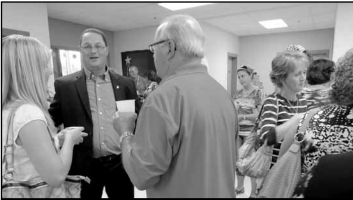
Le député Donald Arseneault pris sur le vif lors de la réception d'accueil des Jeux

C'est à Balmoral que ce sont donné rendez-vous les quelque 250 participantes et participants à la 3e édition des Jeux des aînés de l'Acadie du 23 au 26 août dernier. La bonne humeur et un soleil radieux ont régné en maîtres pendant toute la durée des activités et la chaleureuse hospitalité des gens de la région et du comité organisateur ont fait de ce 3e rendez-vous estival un véritable succès!