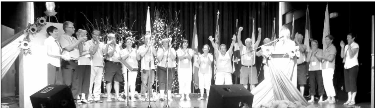
Mission accomplie pour le comité organisateur des Jeux 2012!