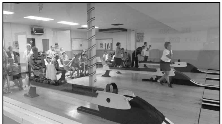
Les compétitions de quilles ont été très populaires lors des Jeux.