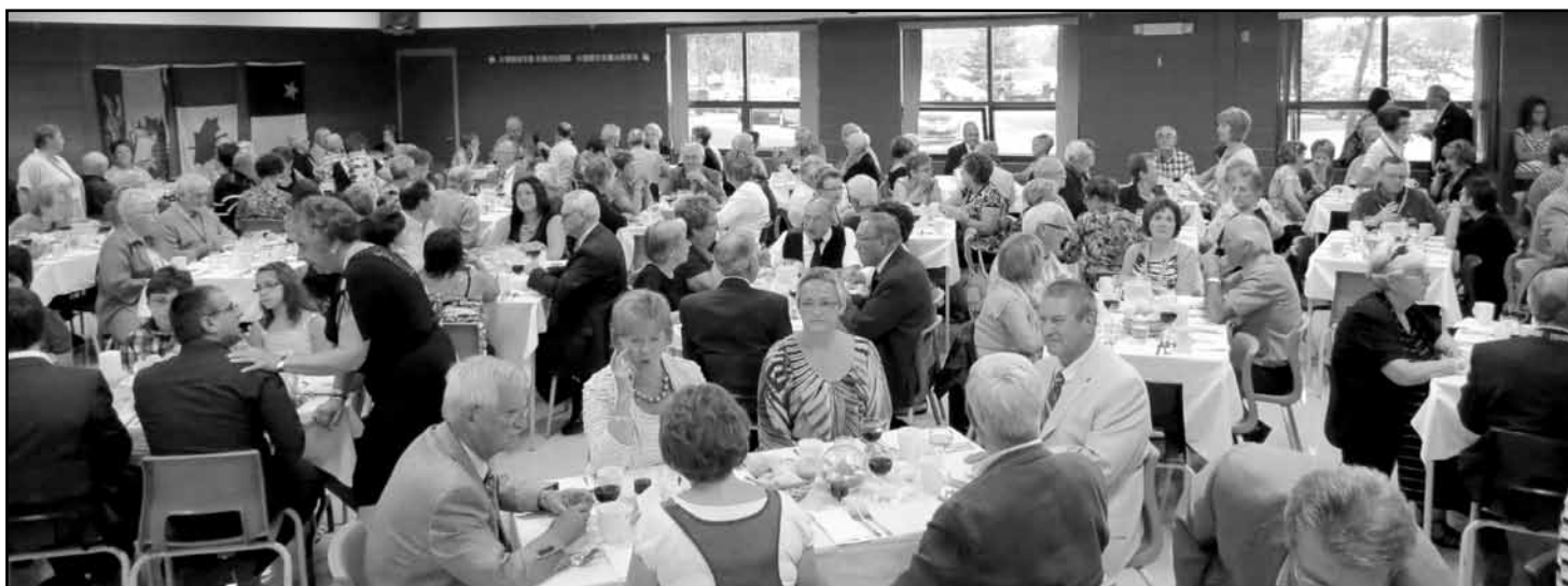
Une photo des convives du Banquet qui couronna de belle façon et dans une atmosphère détendue le Congrès 2012.