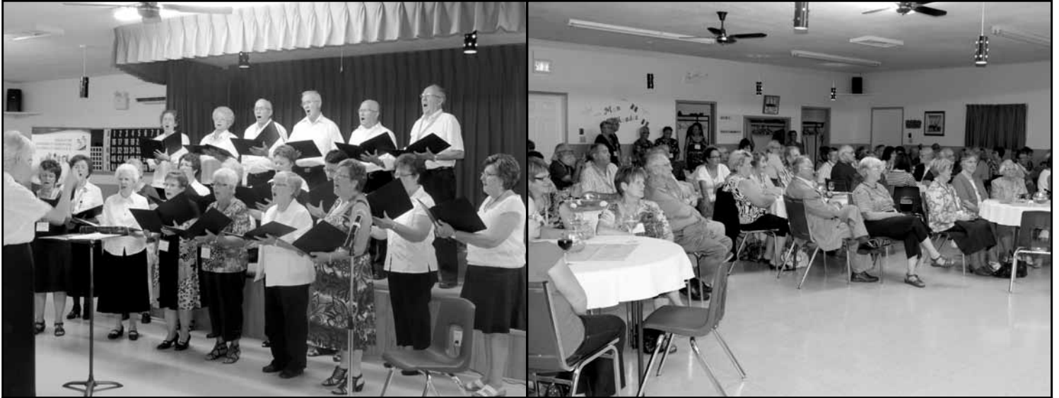
Ci-haut, la Chorale Les Voix de la Mer lors de leur prestation dans le cadre de la Soirée Retrouvailles du 14 septembre et une partie des congressistes participant à la soirée inaugurale des activités de la fin de semaine.

Près de 200 participantes et participants se sont donnés rendez-vous à Bas-Caraquet la fin de semaine du 14 au 16 septembre 2012 pour prendre part au Congrès et à l'Assemblée générale annuelle de l'Association.