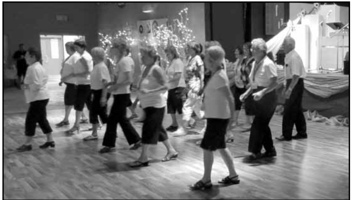
Encore assez d'énergie pour une p'tite danse en ligne!