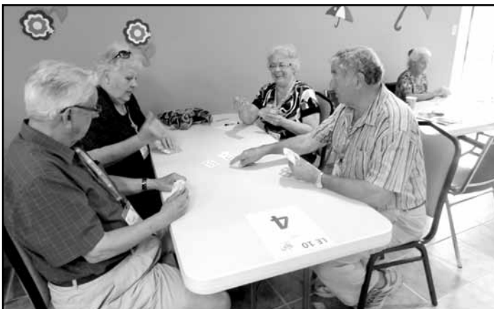
Y'a rien de mieux qu'une bonne petite partie de carte pour passer un après-midi!